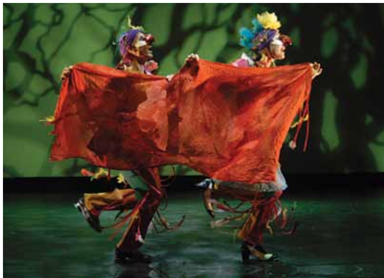
Kaijat vierailivat Kokkolassa ja päätyivät myös G&G:n kansainvälisen esitteen kanteen.

Teatterin tiukan taloustilanteen vuoksi teatteri ei pystynyt investoimaan suunnitelmien mukaisesti kiertuekalustoon. Myöskään muita suuria investointeja ei ollut mahdollista tehdä.