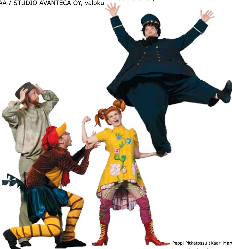
Peppi Pitkätossu (Kaari Martin) vieraili Viktor, hänen kukkonsa Max ja soittorAsian arvoitus -teoksen kuvauksissa.