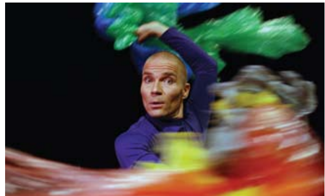
Simon Siivoomosta oli yhteensä 13 esitystä.

Teatteri sai vapaaehtoistyönä yhdistyksen sihteerin työpanokset. Kirjanpidon ja tilintarkastuksen teatteri osti ensimmäistä kertaa erillisenä ostopalveluna.